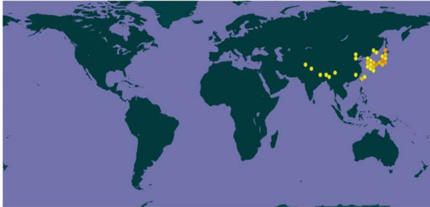
Figura 1.- Los puntos señalan el área de distribución natural de Vespa mandarinia en Asia, con registros en China, India, Bután, Japón, Corea, Laos, Malaysia, Myanmar, Nepal, Rusia, Taiwán, y Tailandia. Mapa generado en https://www.gbif.org/ , el 18 de mayo de 2020.